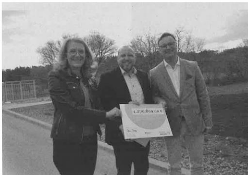
Saar-Ministerin Petra Berg und der Parlamentarische Staatssekretär im Bundesverkehrsministerium, Oliver Luksic, überbrachten zur offiziellen Freigabe der Bliesbrücke mit Banddurchschnitt den Fördermittel-Scheck über 1,27 Millionen Euro.

Es ist schon eine „spannende“ Sache: Hundert Jahre alt könnte sie werden, die neue Bliesbrücke, die Niederbexbach mit Limbach und Kohlhof verbindet. Zumindest ist die seit Dezember 2022 fertig gestellte 37 Meter messende Spannbrücke technisch auf diese beachtliche Lebensdauer ausgelegt.